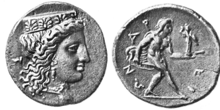
Fig. 2 : Drachme d'Argos . 5,35 g, Londres, BM ( BMC , p. 139, 44) P. R. Franke et M. Hirmer, La monnaie grecque , Paris, 1966, pl. 161.

de la bataille de Leuctres (371). Argos, enorgueilli de ce succès, aurait choisi d'orner le monnayage de la cité avec Héra et le héros Diomède 18 .