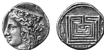
Fig. 1 : Didrachme de Cnossos . 11,08 g, Londres, BM ( PC , p. 43, 54)

P. R. Franke et M. Hirmer, La monnaie grecque , Paris, 1966, pl. 165, n° 544.